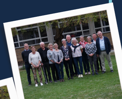
50 års jubilar