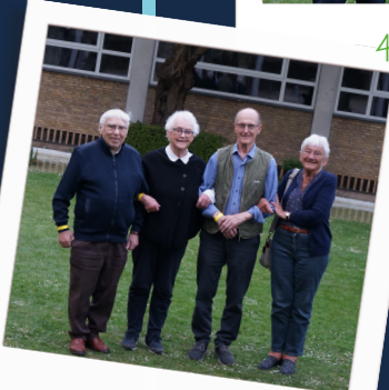
70 års jubilar