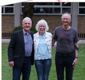
45 års jubilar