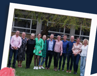
25 års jubilar