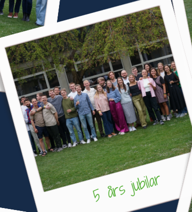
5 års jubilar