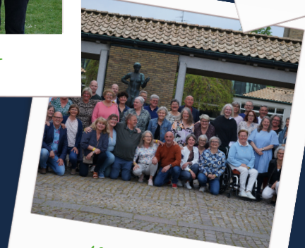
40 års jubilar