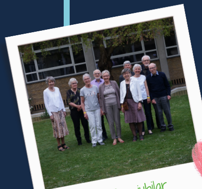
60+ års jubilar