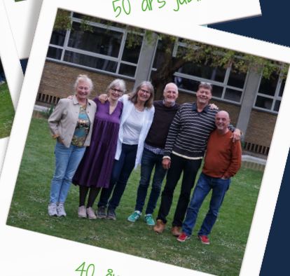
40 års jubilar