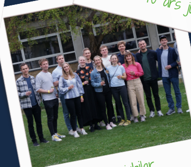
10 års jubilar