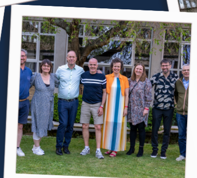
30 års jubilar