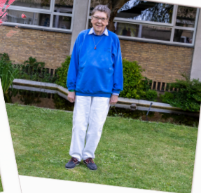
65 års jubilar