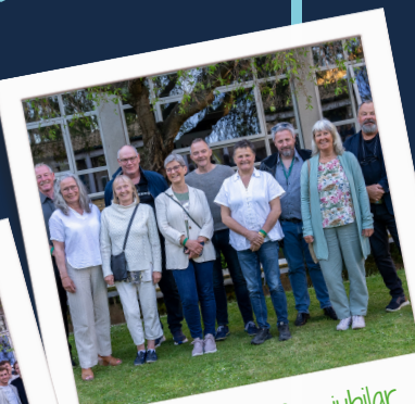
45 års jubilar