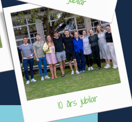
10 års jubilar