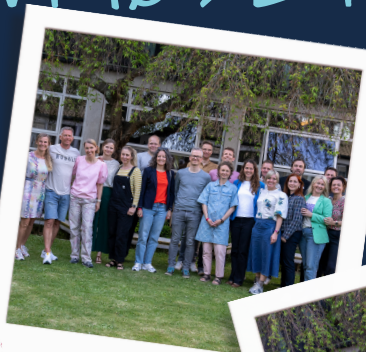
25 års jubilar