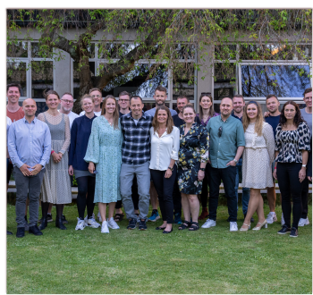
20 års jubilar