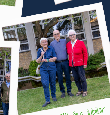
70 års jubilar