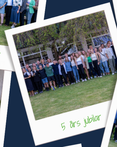
5 års jubilar