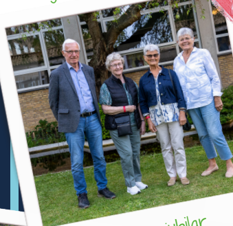
60 års jubilar