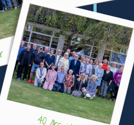
40 års jubilar