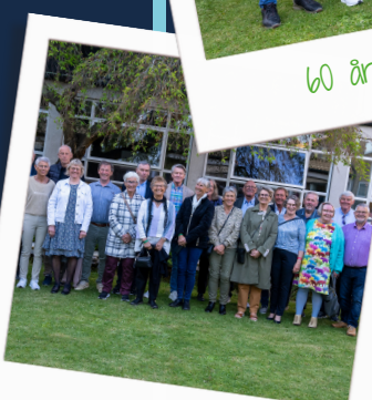
50 års jubilar