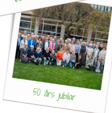
50 års jubilær