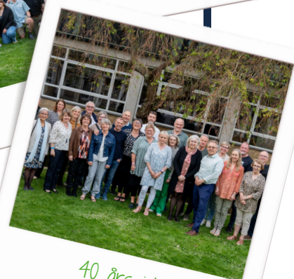
40 års jubilær