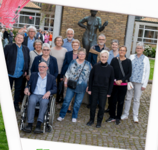
55 års jubilær