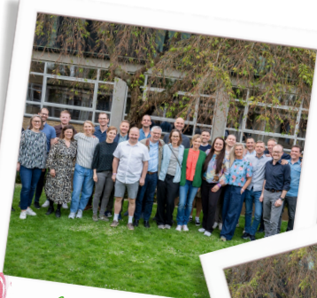
25 års jubilær