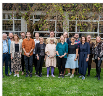
20 års jubilær