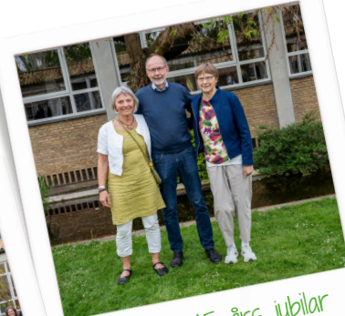
45 års jubilær