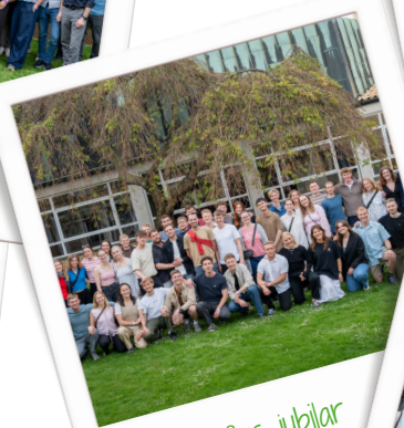
5 års jubilær