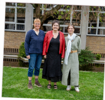
30 års jubilær