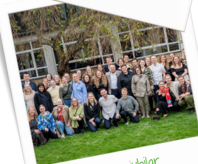
10 års jubilær